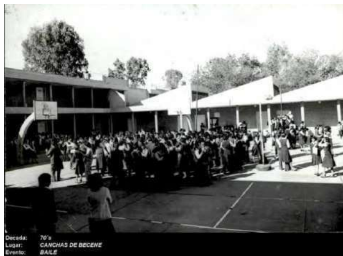
Baile escolar. Año 1970.

Años más tarde fue declarada la Benemérita y Centenaria Escuela Normal del Estado de San Luis Potosí como una institución que admitiría estudiantes de ambos géneros tras publicar su fundador el Decreto No. 41, dando paso a la inauguración de la Escuela Normal Potosina. Durante sus primeros años la Normal estuvo bajo el cargo directivo del Profesor Pedro Vallejo, quien se basaba en los principios rectores de la escuela lancasteriana que supone una enseñanza mutua, por medio de monitores, a diferencia de la enseñanza tradicional.