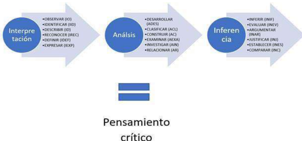
Esquema 5 Dimensiones de análisis seleccionadas del pensamiento crítico

Posteriormente desde los resultados de pensamiento crítico se aborda el alcance del perfil de egreso. Para el proceso de investigación se determinaron dimensiones y categorías de análisis determinadas por el pensamiento crítico según Facione, que se vinculan con el perfil de egreso del Plan y Programa de Estudios 2012. Las tareas orientadoras desarrolladas corresponden a: