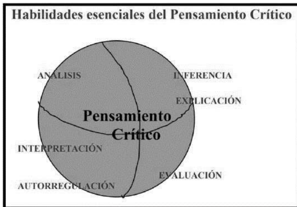
Esquema 1 Facione, 2007. Habilidades esenciales del pensador crítico.

Para ello, además necesita tener la capacidad de cambiar de opinión cuando sea prudente según la evidencia. Así, Facione (2007) sugiere el siguiente esquema que define las habilidades esenciales del pensamiento crítico que lo conforman: