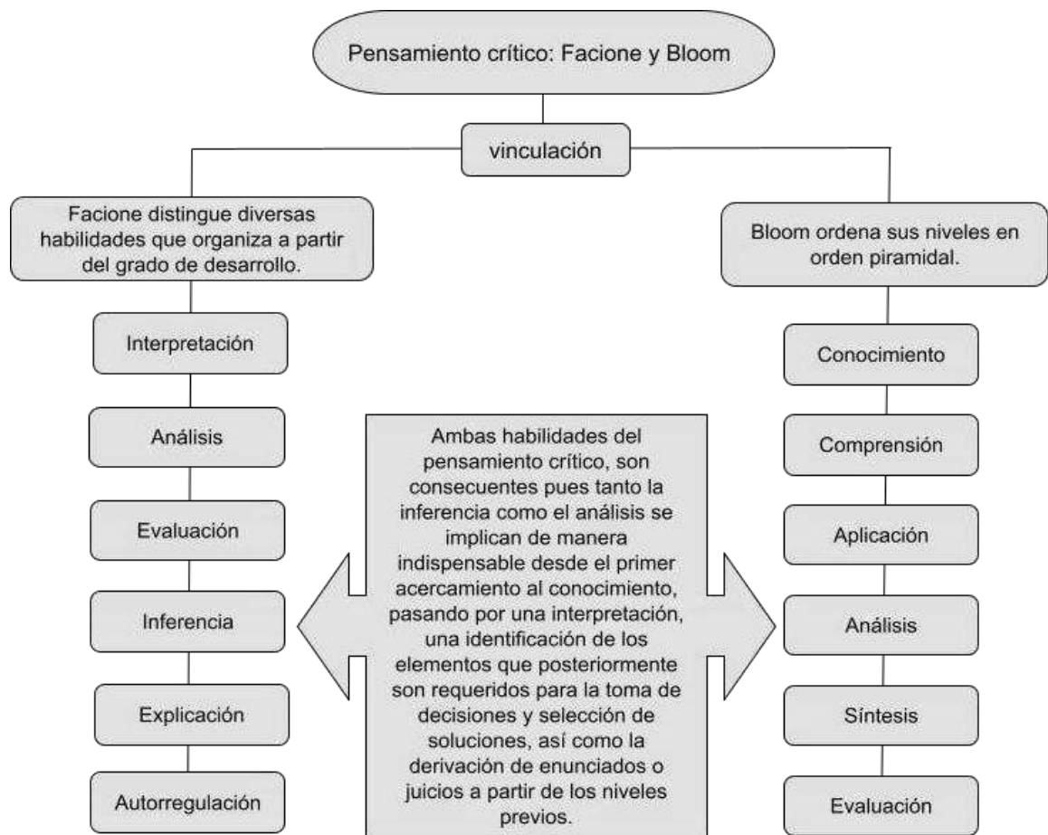
Esquema 3 Vinculación del pensamiento crítico según Facione y Bloom