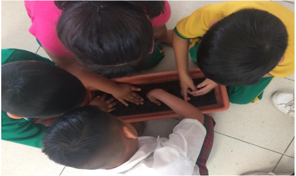
Anexo 7.1. Creación del huerto