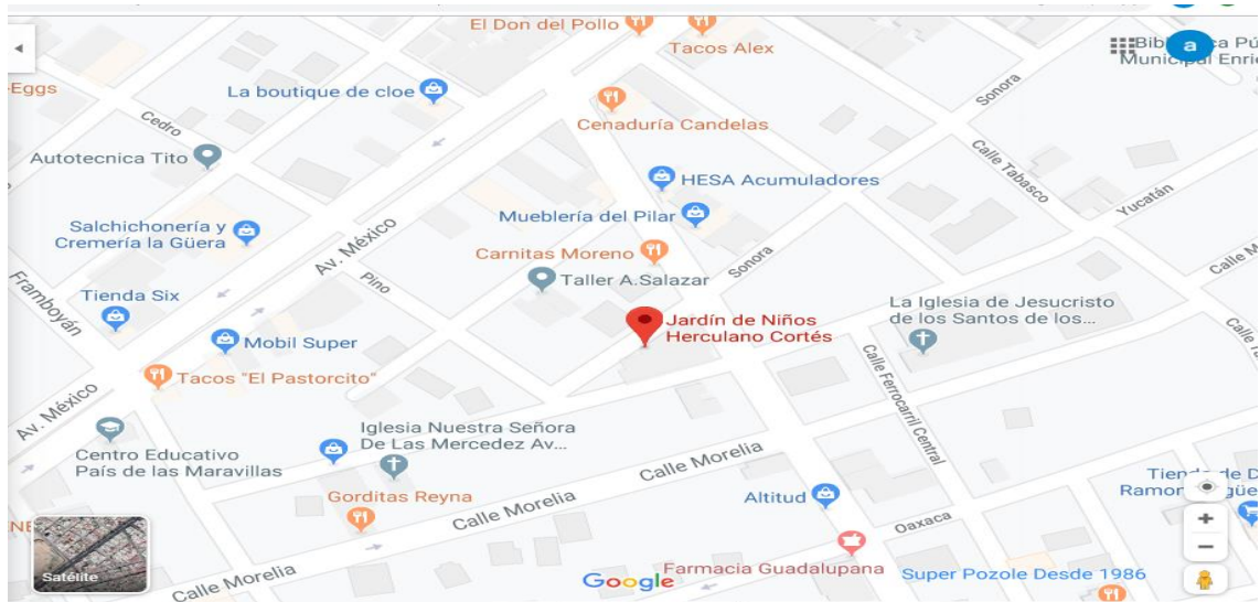
Anexo 1.0. Localización física del Jardín de Niños "Herculano Cortés"