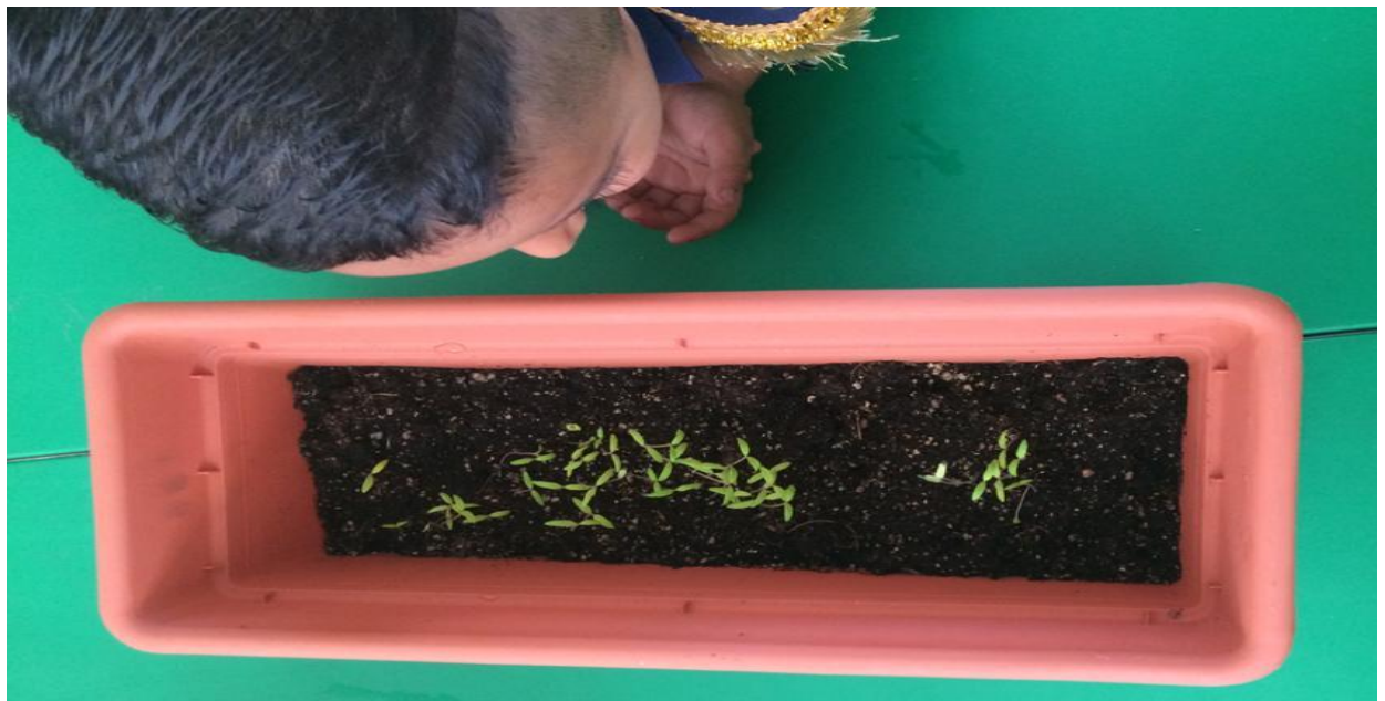
Anexo 7.4. Seguimiento del crecimiento de las plantas.