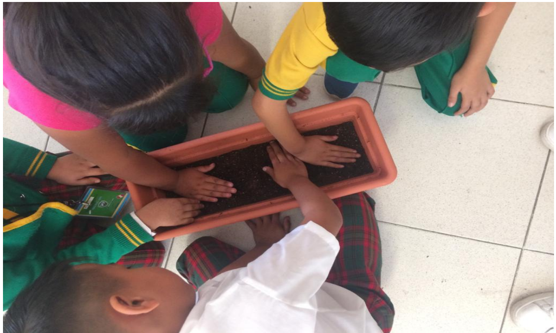
Anexo 7. Actividad de creación del huerto.