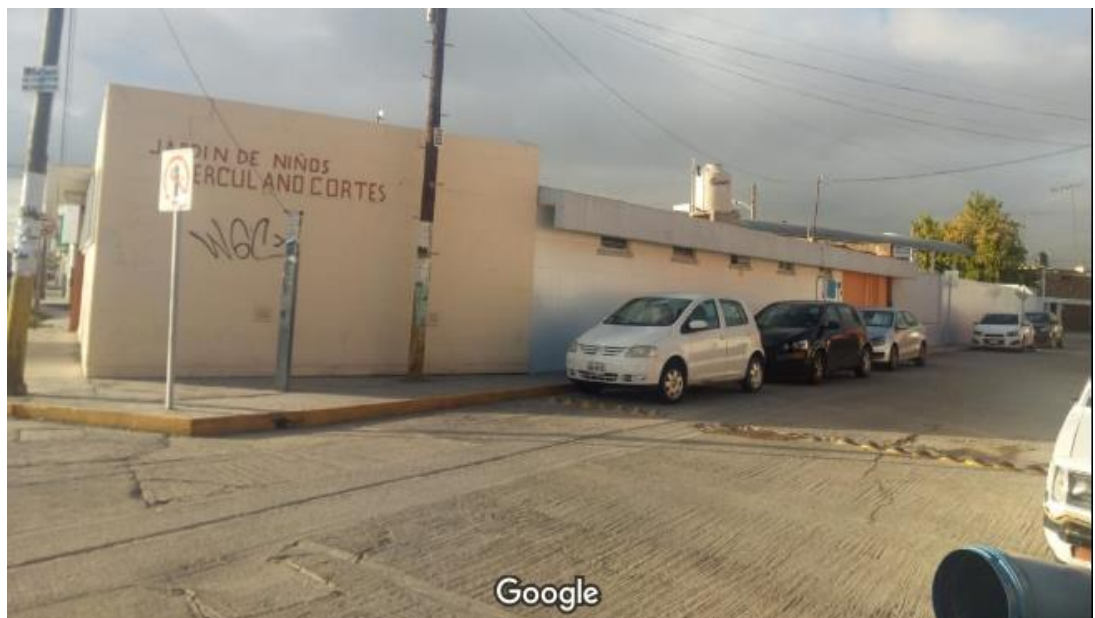
Anexo 1.1. Infraestructura de la escuela.