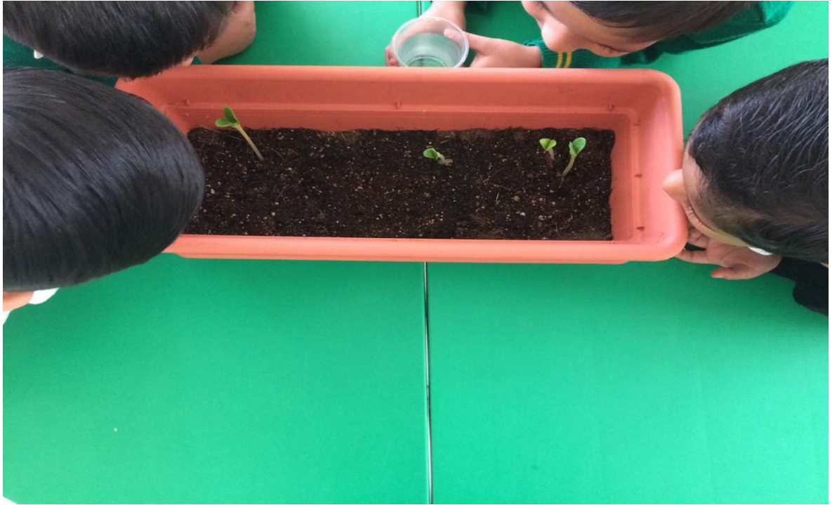
Anexo 7.5. Seguimiento del crecimiento de las plantas.