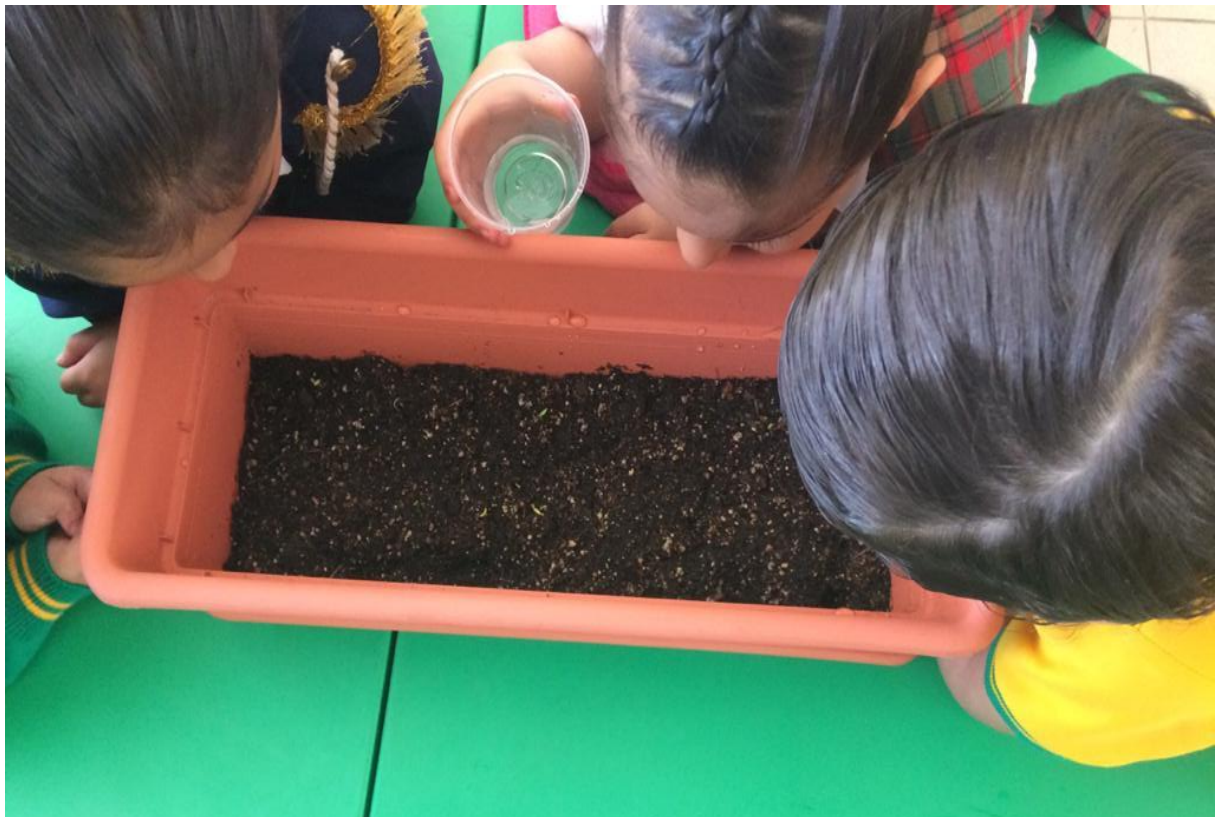
Anexo 7.2. Aplicación de los cuidados para el huerto.