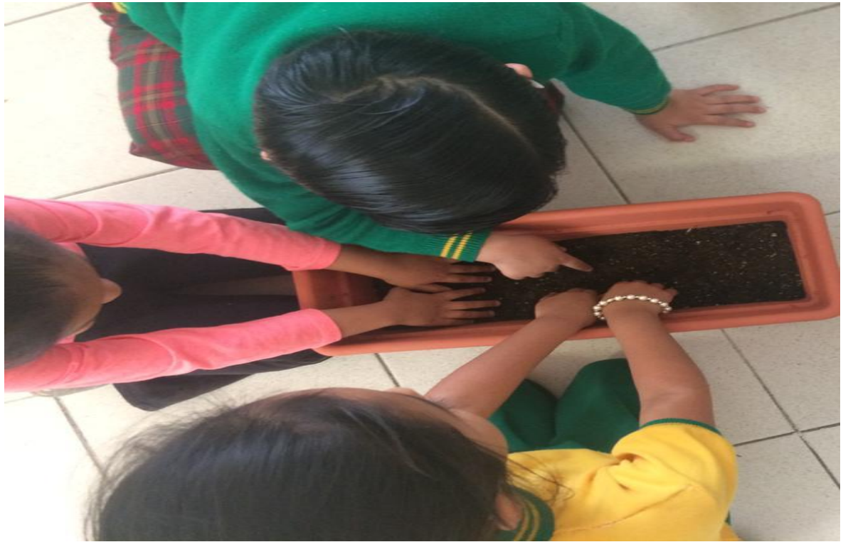
Anexo 7.3. Explorando los elementos que conforman al huerto.