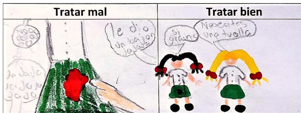
Imagen 1: Ejemplo de situaciones de tratar mal y tratar bien

En otra actividad, las y los estudiantes identificaron situaciones de género que reflejaran actos de maltrato, discriminación o prejuicio (Unidad temática 5: “Desactivemos la violencia, LEÑERO, 2010, pp.139-141), pues como señala Vázquez (2012) la presencia de estereotipos ocurre a la par de dichos conceptos. Para el desarrollo de esta actividad, a cada estudiante se le proporcionó una hoja donde debían identificar situaciones que representarían “tratar mal” a alguien y de qué manera se podrían intervenir para “tratar bien”.