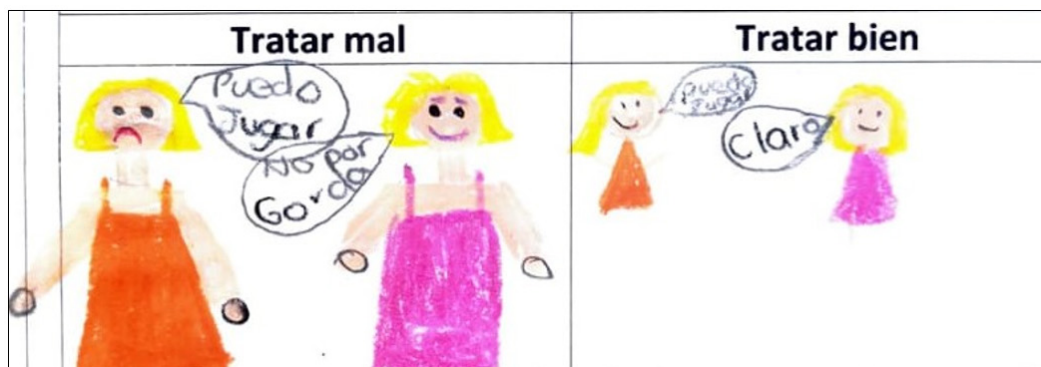
Imagen 2: Ejemplo de situaciones de tratar mal y tratar bien