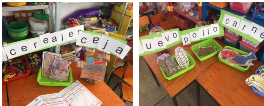
Imagen 4. Acomodo de espacio del mercado.

D.F: Claro que sí pasen para ver qué productos pueden encontrar para que se den una idea, recuerden todo lo que hemos trabajado en la semana, recuerden que han hecho ¿Lo recuerdan? si no es así pasen y vean primero los productos