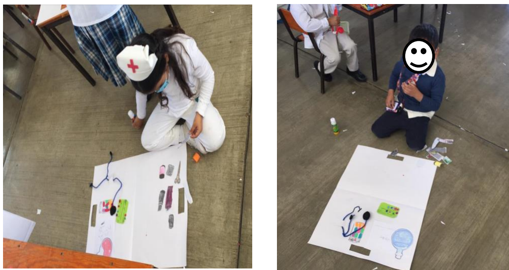
Imagen 11. Conteo y selección de elementos para botiquín de emergencias.