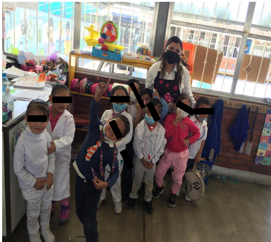
Imagen 13. Presentación de la personificación conforme a la temática planteada.

Viéndose reflejado el principio de correspondencia uno a uno, orden estable y abstracción que como nos menciona este principio los elementos son independientes conforme a las cualidades a contar esto quiere decir, que para contar las reglas de números son iguales y son las mismas para contar números de diferentes naturalidad o clasificación de elementos. Pues, aunque en un inicio se mostró en conjunto diferentes cantidades de elementos no se vio afectado que solo debían de elegir de una clasificación.