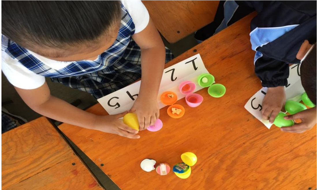
Imagen 16. Llenado de dulces en los huevos según la cantidad.

Esta actividad resultó dinámica para los niños, por un lado, por la manipulación de materiales, segundo por el interés por los dulces y finalmente, porque se puede observar cómo en cada correspondencia se colocó la cantidad solicitada conforme a la serie numérica. Sin embargo, considero que puede ampliar la serie al número 10 o bien, jugar con cantidades un poco más grandes como el 12 o 13, situación que me hubiera servido para observar la zona de desarrollo próxima en algunos alumnos que ya identifican hasta el 10. No obstante, se realizó el ajuste en la serie numérica, ya que, por el imprevisto de la junta con los padres de familia, sólo puede trabajar con una correspondencia numérica del 1 al 5. Rescató que este ajuste me permitió observar que los alumnos dan un mejor sentido a los números y no solo lo manifiestan por mera repetición de los mismos. El reto será repetir la actividad, pero con una serie numérica mayor.