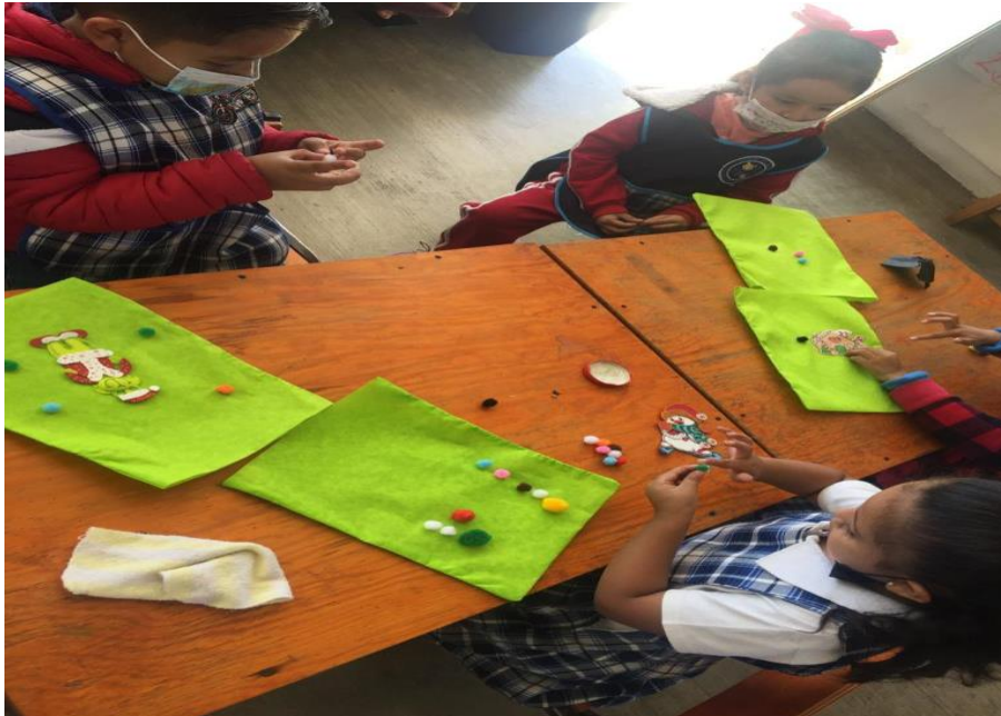
Imagen 8. Decoración de aguinaldos

Una vez que terminaron de dicha decoración, procedieron a la recolección de los dulces los cuales serían respetando la cantidad de diez elementos, para mejores resultados implementé una serie numérica con los criterios del 1 al 10 aunque en la en la primera indicación los resultados fueron buenos, mejoraran ya al tener visualizada dicha serie y guiarse mejor.