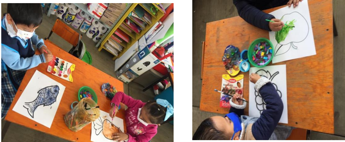
Imagen 3. Realización de productos del mercado.

que permitió continuidad de los alumnos en el tema. Días previos, a través de una actividad los alumnos hablaron sobre el mercado que se ubica cerca de nuestro jardín, se habló sobre qué podemos adquirir en él, dónde podemos encontrar los productos y se simuló la organización y elaboración del espacio de un mercado dentro del salón de clases, esto para mejor intervención de los niños en la actividad, siendo esta una acción intencionada para mejor desarrollo de la actividad, generando en los alumnos un clima involucrándolos en una situación que se puede llevar a cabo en la vida cotidiana con una recapitulación de comentarios de manera grupal platicando si lo han hecho con sus papás, a qué mercados los han acompañado y qué productos han adquirido en dicha situación.