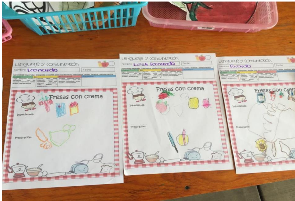
Imagen 7. Hoja de trabajo comunicación de productos adquiridos.

número cuatro, siete, ocho hasta llegar al número diez, no con la finalidad de buscar un orden si no de mencionar al final la cantidad de elementos solicitados en este caso hasta el 10, tal como se muestra en algunas hojas de trabajo mostradas a continuación.