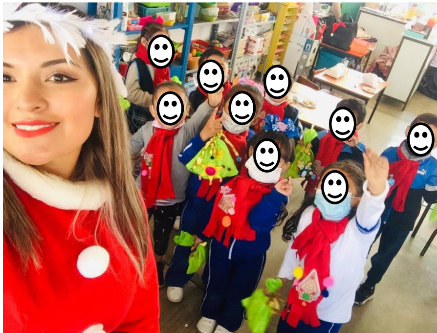
Imagen 10. Demostración de aguinaldos navideños e intercambio

A los niños les agrado mucho la actividad, pues los integró a una situación que pueden llevar a cabo cotidianamente un ejemplo de ello podría ser ayudar a mamá o papá en hacer sus propias bolsas de dulces para su fiesta de cumpleaños dependiendo así el grado de dificultad que se presente. Esta actividad se notó favorecida y de interés para los alumnos gracias a los materiales utilizados pues era algo nuevo para ellos, ya que al ser niños de nuevo ingreso por cuestiones de la pandemia por Covid -19 y su habilidad de conteo se propicio al hacer una correspondencia de dulce en la cantidad solicitada de la serie numérica.