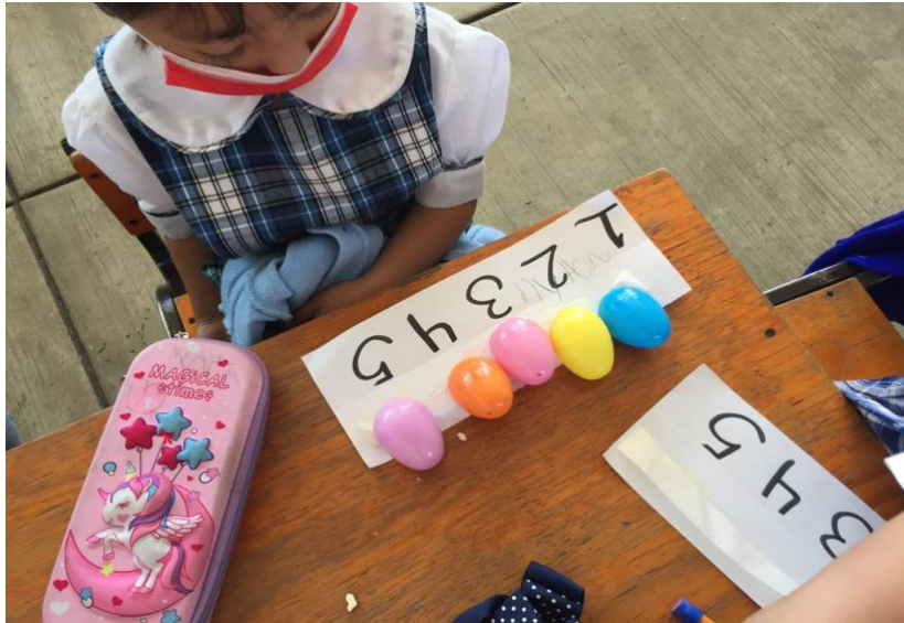
Imagen 15. Acomodo de los huevos en la serie numérica.

Al regresar al salón se les repartió a los alumnos una tabla de cartulina con la serie numérica del 1 al 5 en la cual, con uso del principio de correspondencia uno a uno, deberían de colocar un huevo a cada uno de los números hasta llegar a 5.