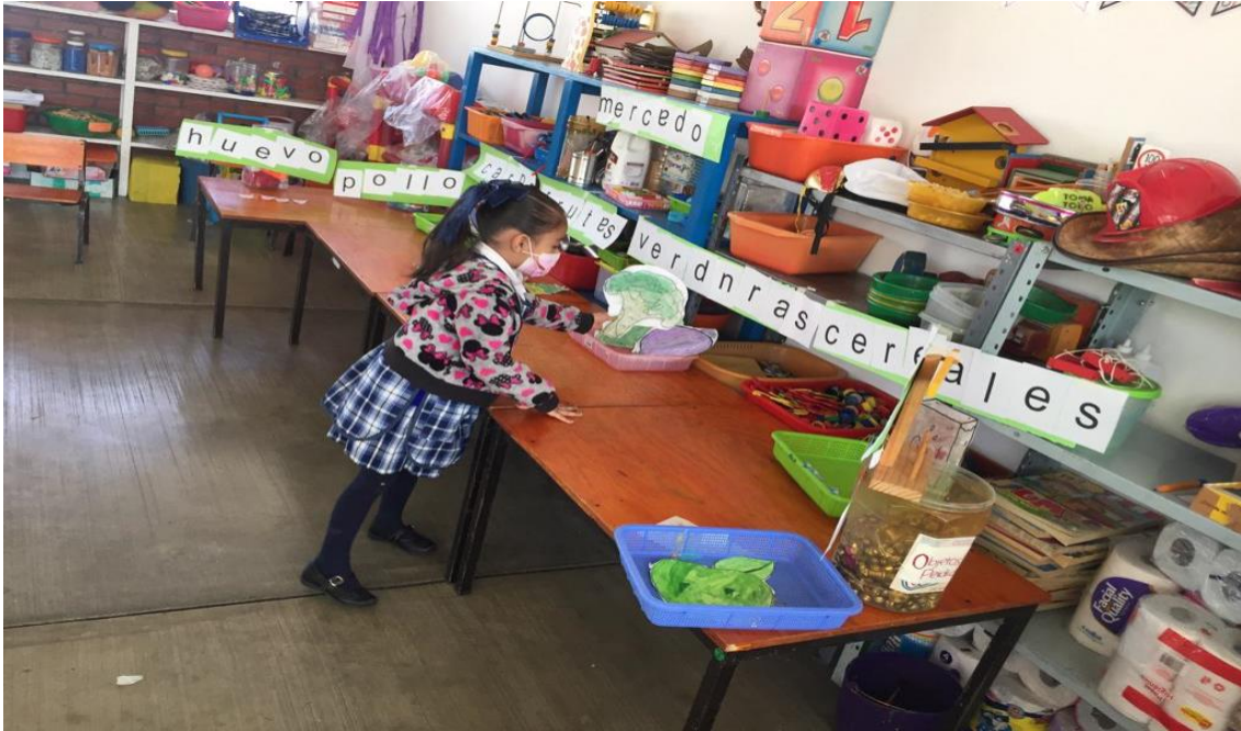
Imagen 5. Selección de productos para lista del mandado.

Los alumnos procedieron a pasar a visualizar los productos, al observarlos los niños pudieron darse una idea de qué querían surtir para su lista del mandado de manera intencionada para en los siguientes días hacer la realización de dicha receta, se estableció un tiempo determinado para la recolección de productos.