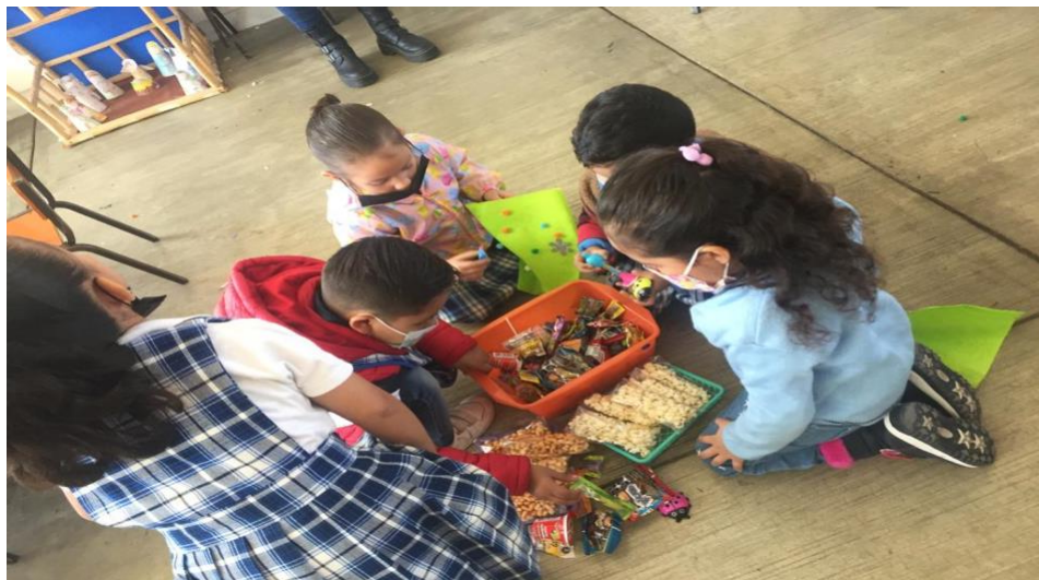
Imagen 9. Recolección de los dulces para aguinaldos

Una vez que terminaron de dicha decoración, procedieron a la recolección de los dulces los cuales serían respetando la cantidad de diez elementos, para mejores resultados implementé una serie numérica con los criterios del 1 al 10 aunque en la en la primera indicación los resultados fueron buenos, mejoraran ya al tener visualizada dicha serie y guiarse mejor.