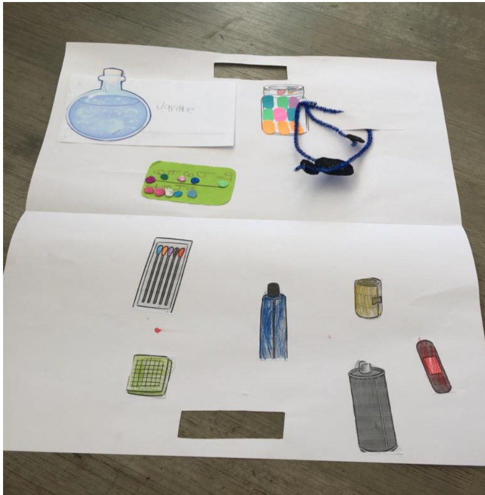
Imagen 12. Presentación de botiquín del alumno 1.

Esta actividad fue de interés, ya que como este día asistieron caracterizados con la temática de la farmacia, su participación de manera oral propicio el aprendizaje de la sucesión numérica oral de los primeros números con forme lo menciona el plan de estudios pues al momento de su participación se obtuvieron los resultados esperados del aprendizaje esperado.