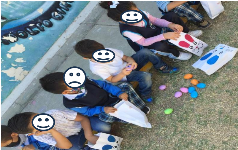
Imagen 14. Recolección de los huevos.

D.F: Bueno la siguiente indicación es que en las bolsas que les proporcioné deberán de buscar en el pasto la cantidad de 5 huevos, estos pueden ser del color que ustedes quieran, si ven que un compañero ya tomó uno no puedes pelear, busca otro el cual sea de tu agrado, ¡pueden comenzar a la 1, a los 2 y a las 3!