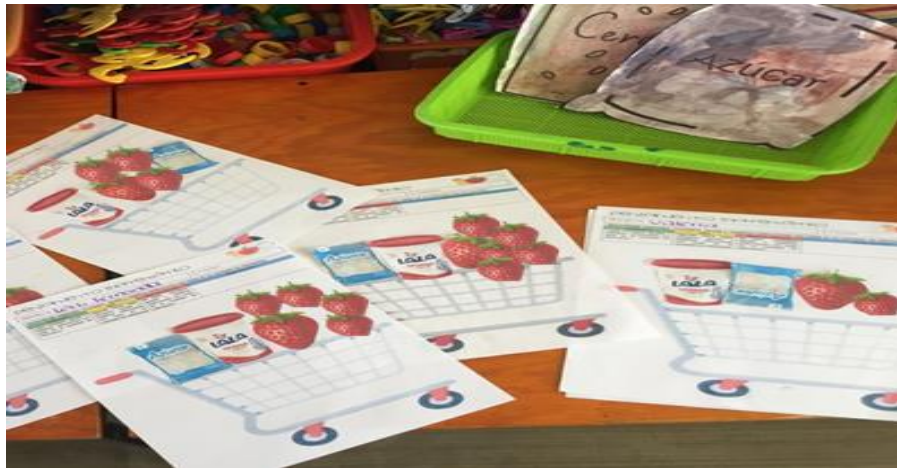
Imagen 6. Contabilidad de productos seleccionados por alumno.

A.I: Pues mi mami siempre la junta con la crema y así le mezcla y luego ya pone las fresas y todo eso lo pude en mi carrito maestra, pero ahorita todavía me falta dibujarlos en mi hoja.